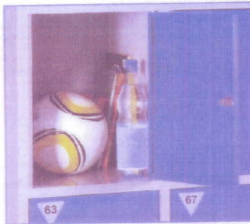
Fach 1: Standard Fach 46 cm x 35 cm x 50 cm (HxBxT)